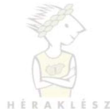
Összeállította: Pucok József Márton