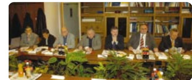
MOB - NUPinfo

nevelési Intézetben folyó munkáról. A négy éve alakult állami szervezet az idén már több mint 2,3 milliárd forinttal támogatja a magyar sport utánpótlását, amely óriási segítség az erre hovatovább áldozni képtelen szövetségeknek és egyesületeknek. A főigazgató szerint a fiatalok 2005-ös eredményei – majd' 150 érem a különböző vb-ken és Eb-ken – már mutatják, hogy a rendszer működőképes, azaz a jövőkép hízelgőbb, mint a kilencvenes évek végén, ugyanakkor jelezte: egészen katasztrofális a magyar oktatáspolitikának az iskolai testneveléshez fűződő kapcsolata, ami nem csupán a tehetségek felfedezését nehezíti meg, de az ország egészségügyi mutatóinak sem „tesz jót”.